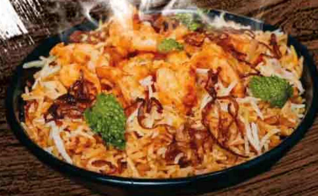
Prawn Biryani Basmati-Reis mit gebratenen Riesengarnelen